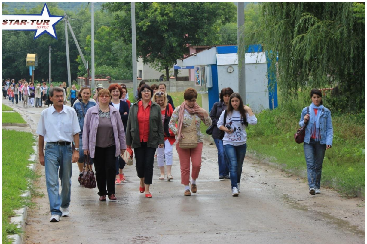
2013 – Colectivul Bibliotecii ASEM în călătorie la Saharna