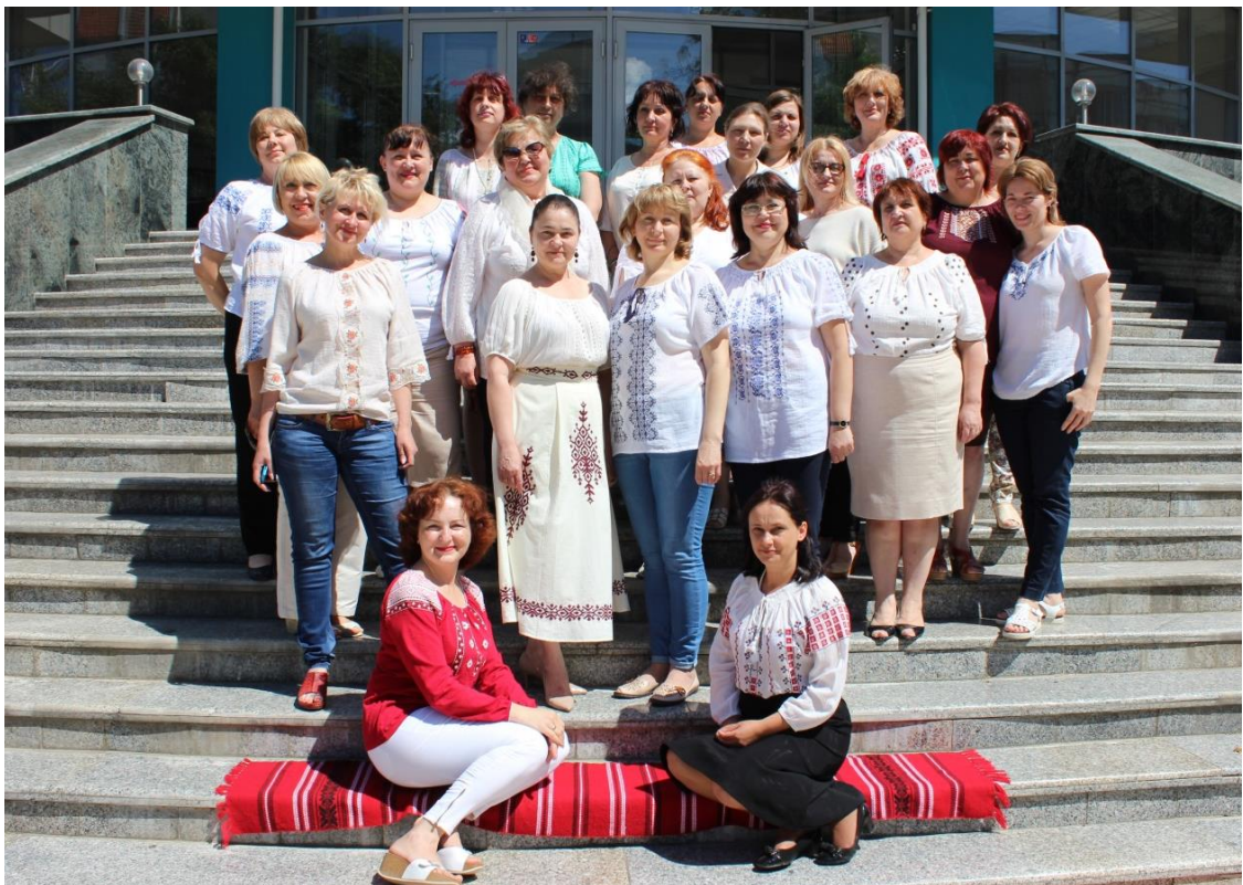
2017 - Colectivul Bibliotecii ASEM