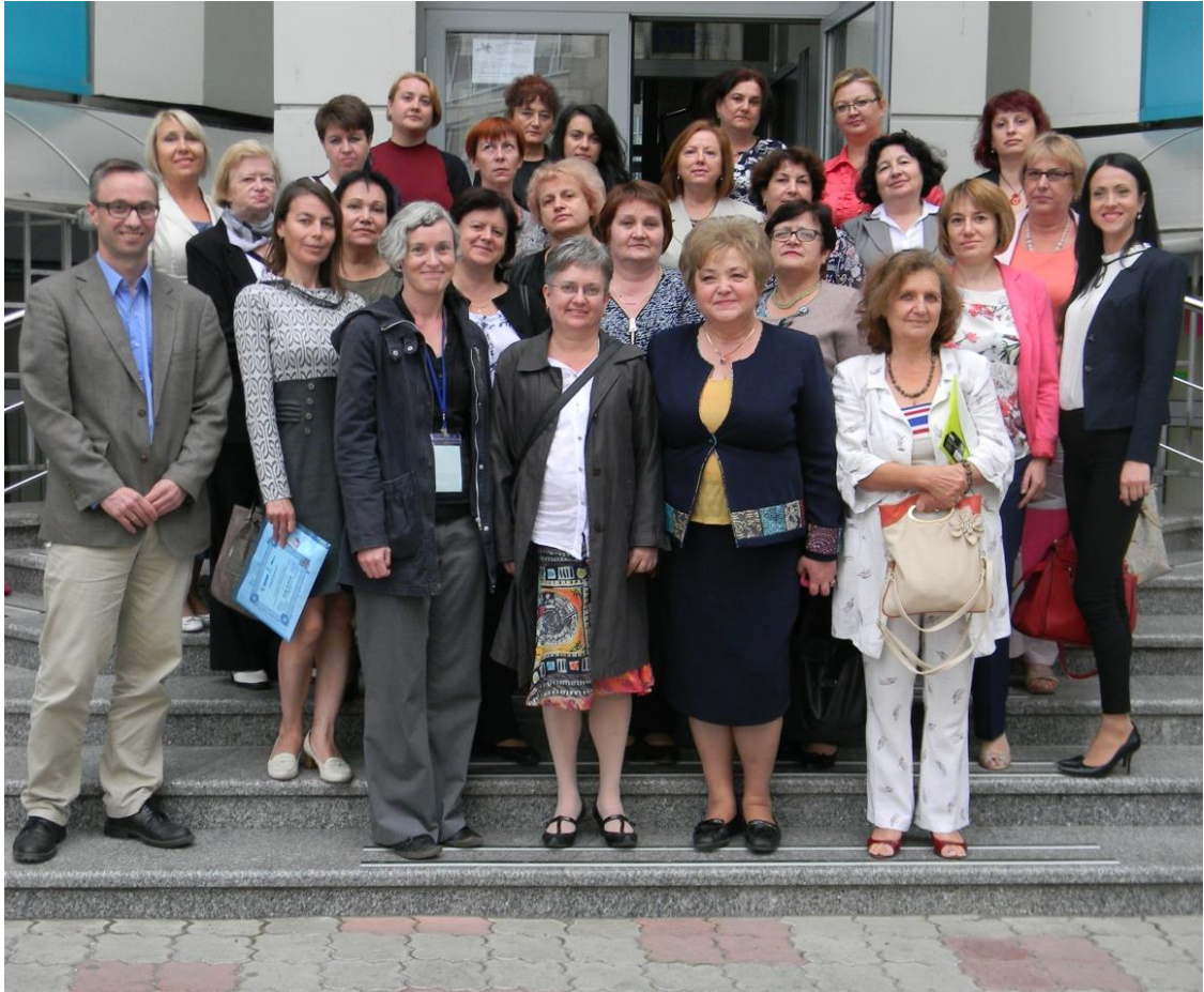
2016 - Workshopul „Acces Deschis și Repozitorii instituționale”