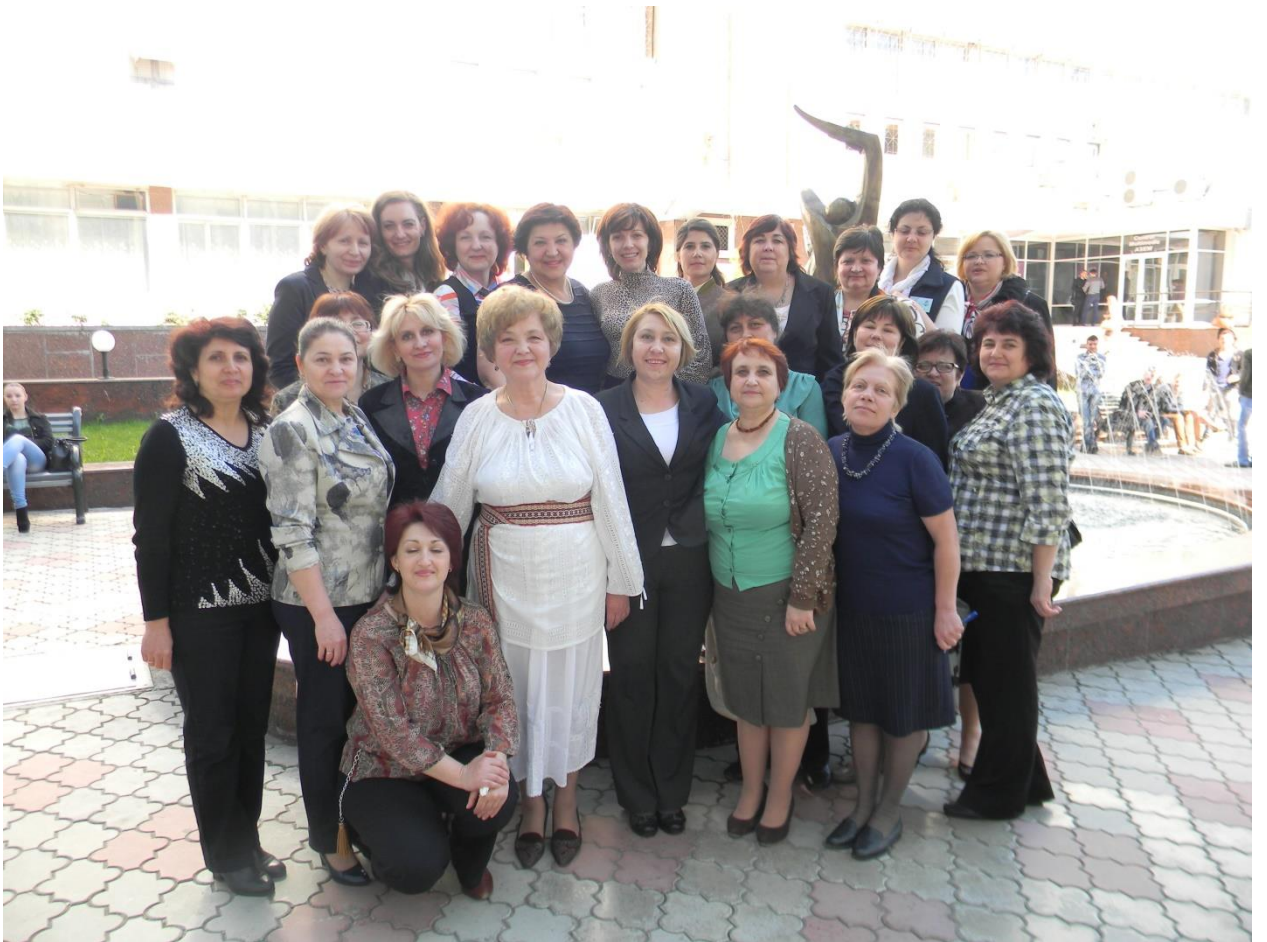
2014 - Colectivul Bibliotecii ASEM