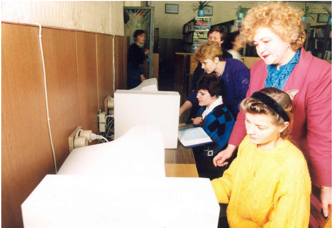
1994 – Primii pași în ale automatizării