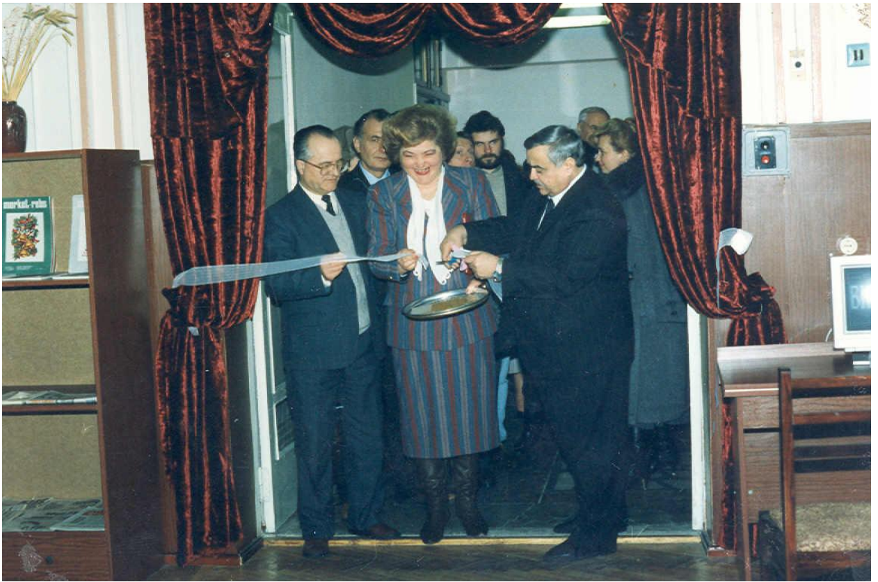
1995 - Inaugurarea Sălii de lectură nr. 5