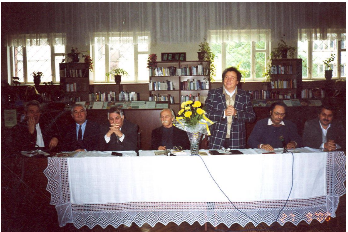
2000 - Cenaclul „Junimea”