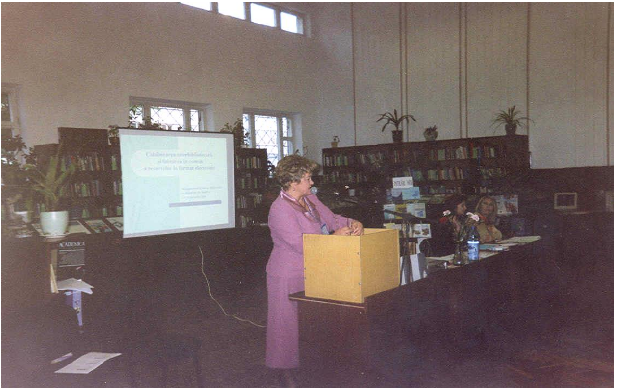
2003 – A II-a Conferință Internațională „Managementul resurselor electronice în bibliotecile din Republica Moldova”