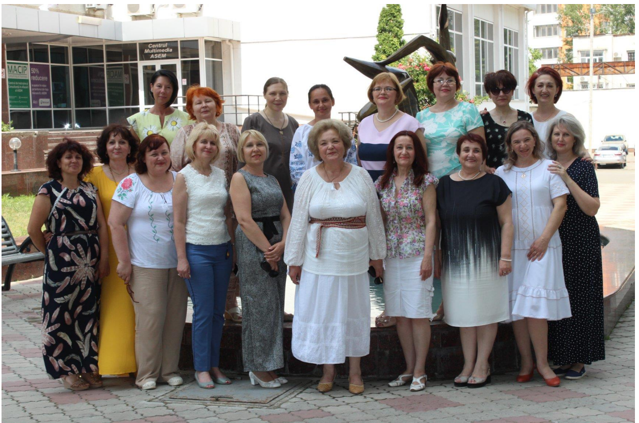
2019 – Colectivul Bibliotecii ASEM