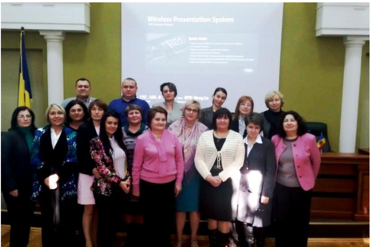
2015 - Biblioteca ASEM participă în proiectul Tempus MISISQ