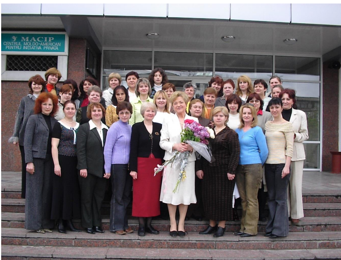
2005 – Colectivul Bibliotecii ASEM