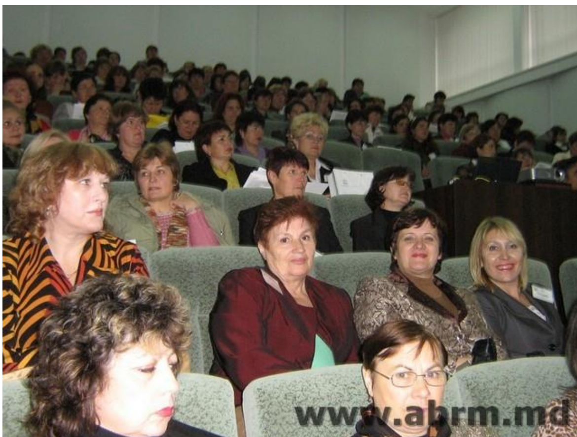
2008 – Bibliotecarii de la ASEM la Conferința ABRM