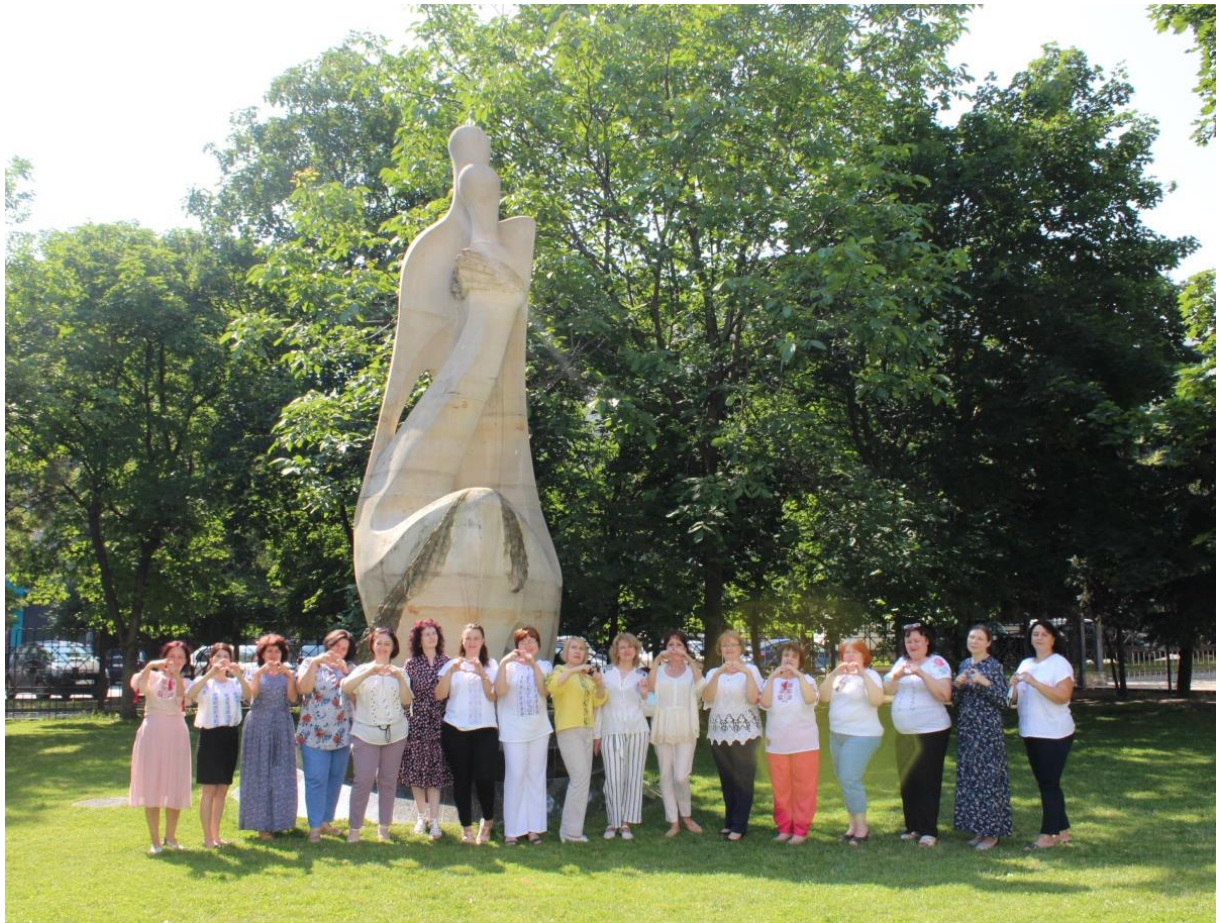
2021 - Colectivul Bibliotecii ASEM