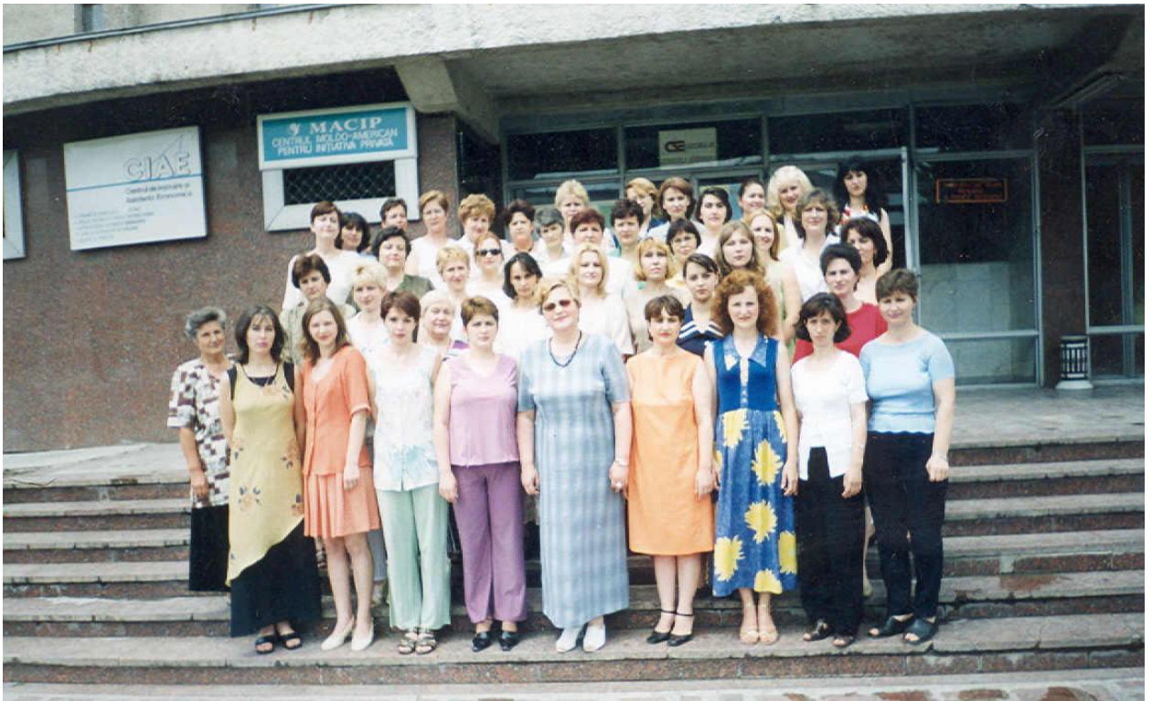
2001 – Colectivul Bibliotecii ASEM