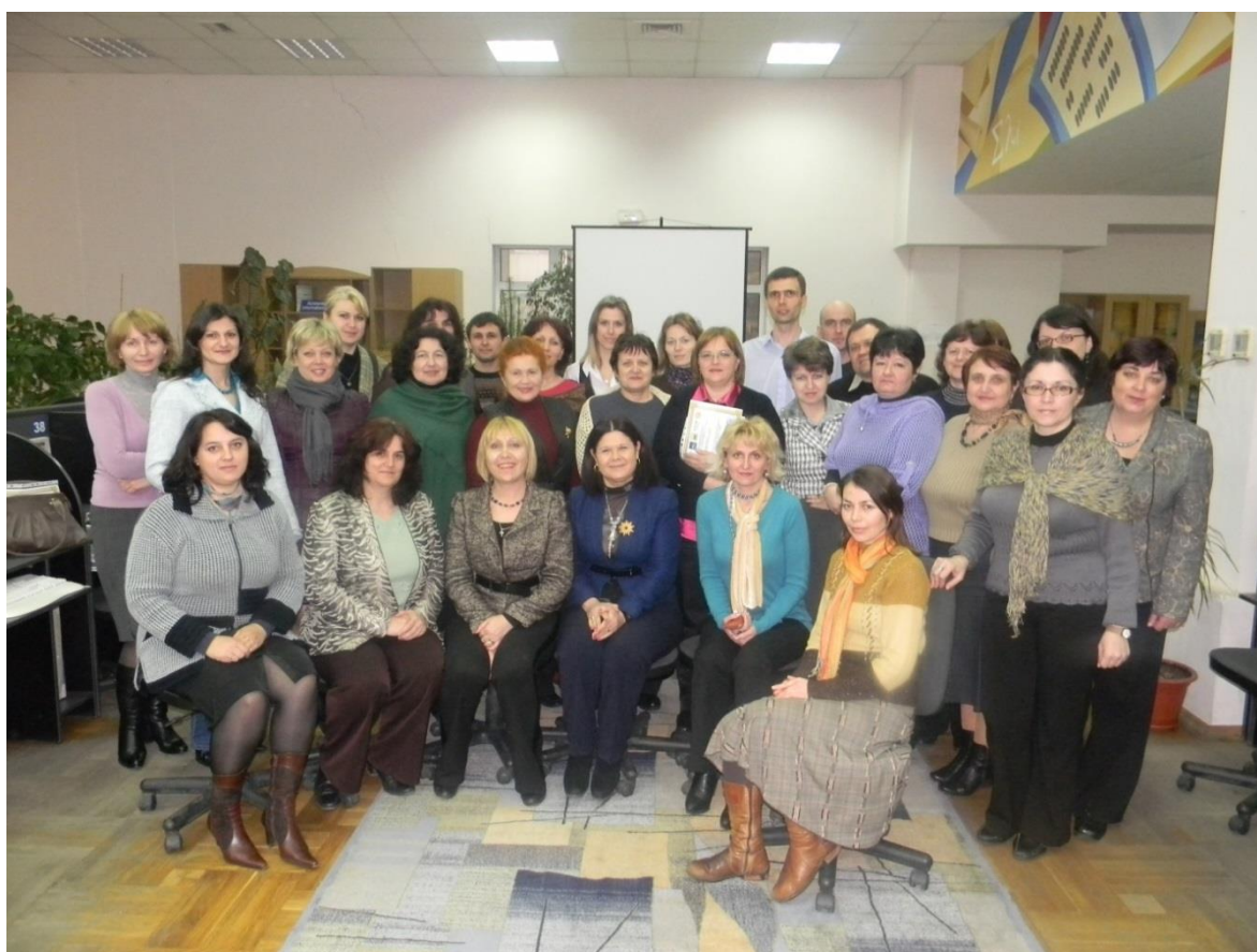
2011 – Seminar „Implementarea tehnologiei IR: Sistemul DSpace”