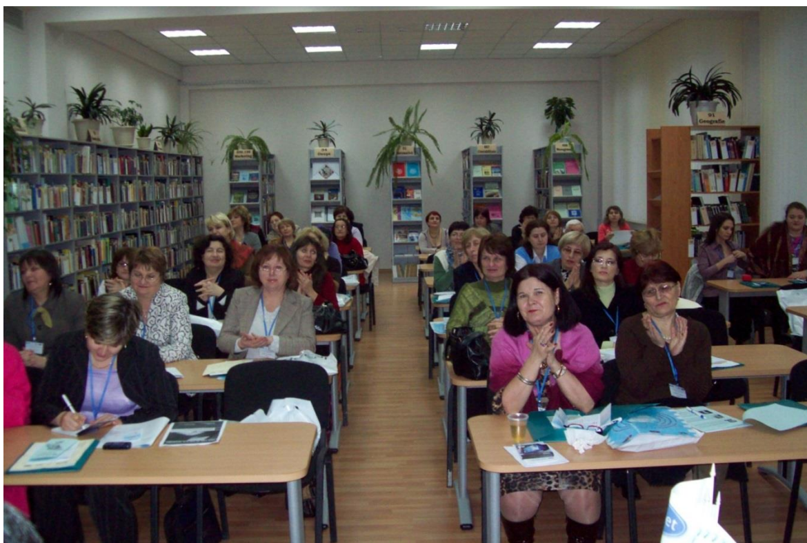
2009 – Seminar „Advocacy pentru bibliotecari”