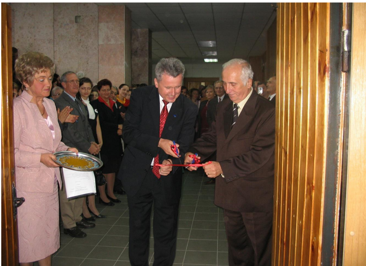
2005 – Inaugurarea Sălii de lectură „Paul Bran”