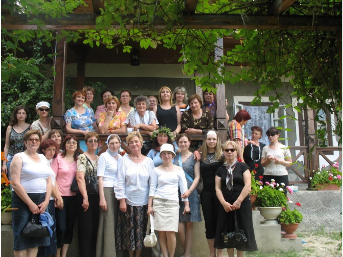
2006 – Colectivul Bibliotecii ASEM în călătorie la patru mănăstiri în Codri, Călărași