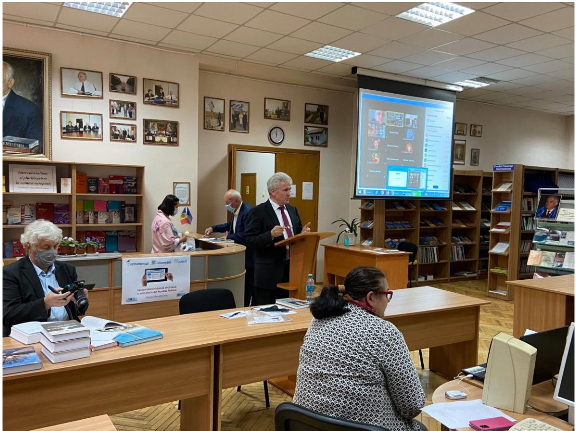
2020 – Lansarea cărții „Paul Bran – personalitate marcantă a științei românești: la 80 de ani de la nașterea marelui economist”