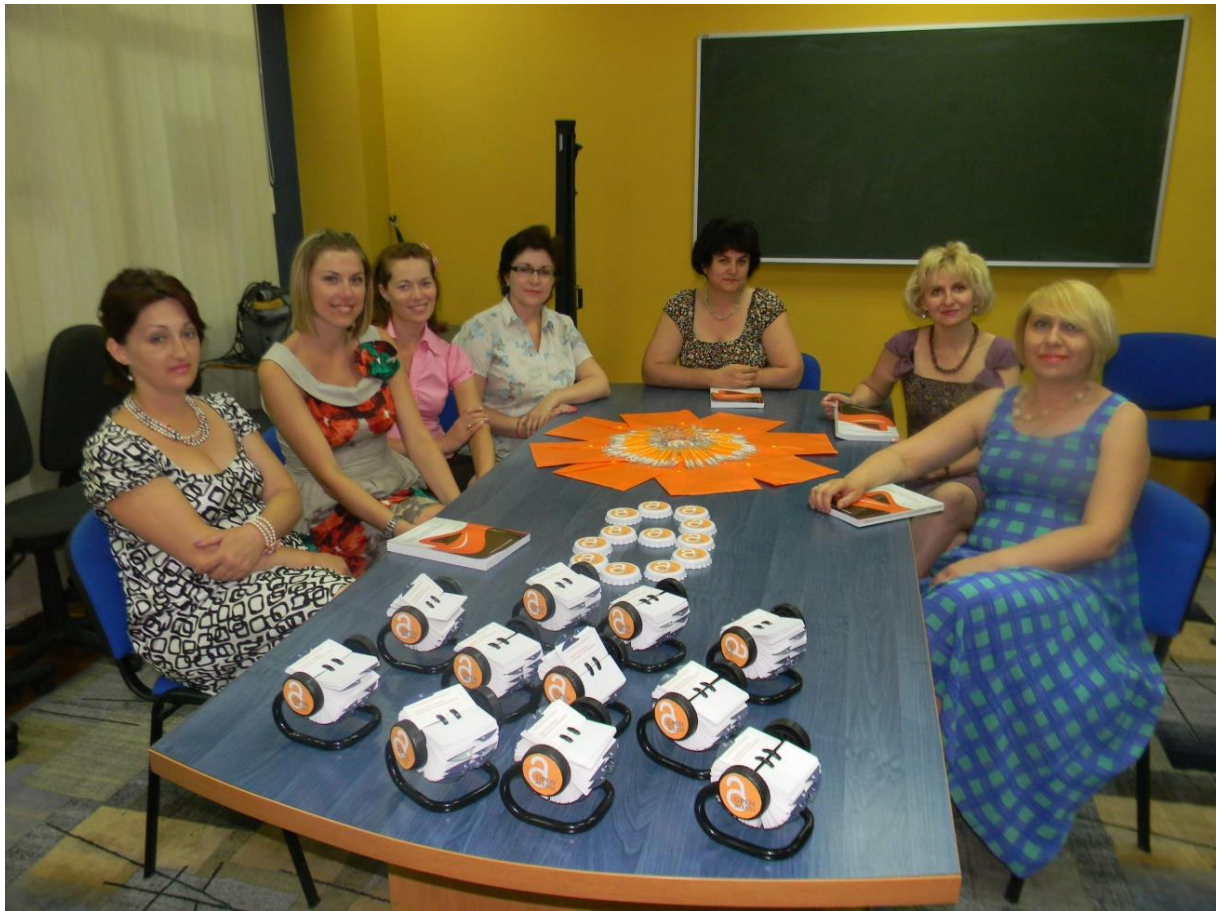
2012 – Săptămâna Internațională a Accesului Deschis