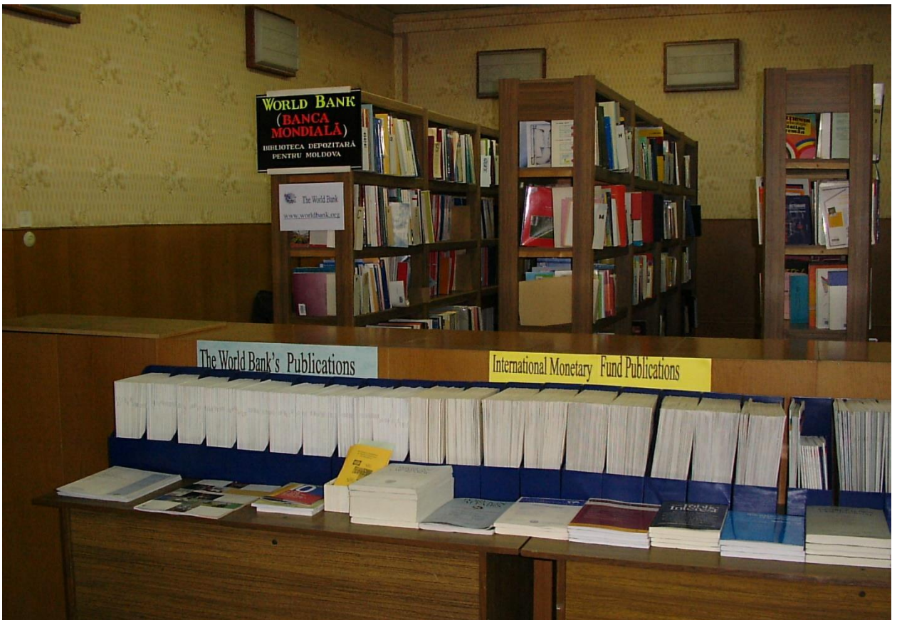
2002 – Sala de lectură „Colecția în limbi străine” până la renovare