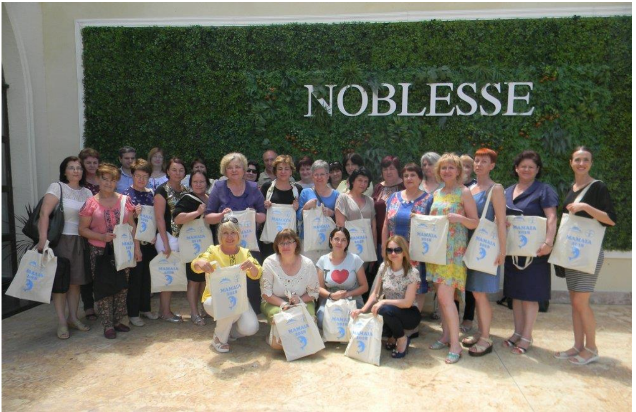
2018 – Școala de vară „Bibliotecarul de referințe în era digitală” în Constanța-Mamaia, România