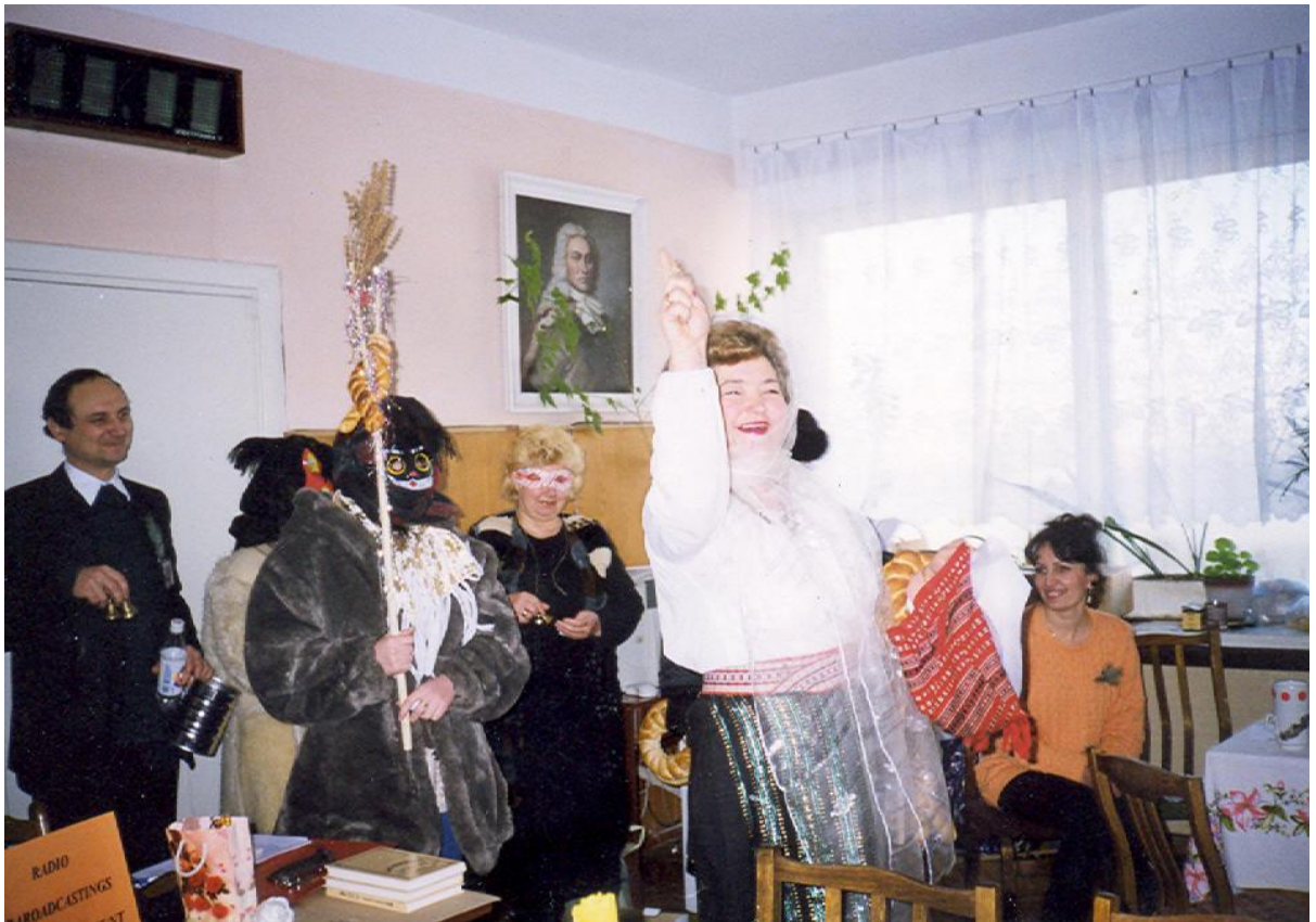
1999 - La mulți ani!