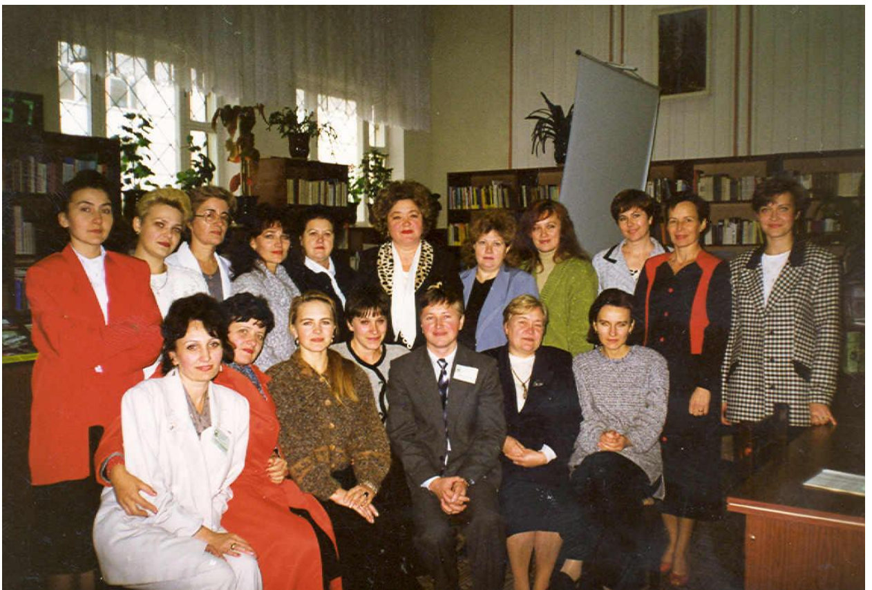
1996 - Colectivul Bibliotecii ASEM