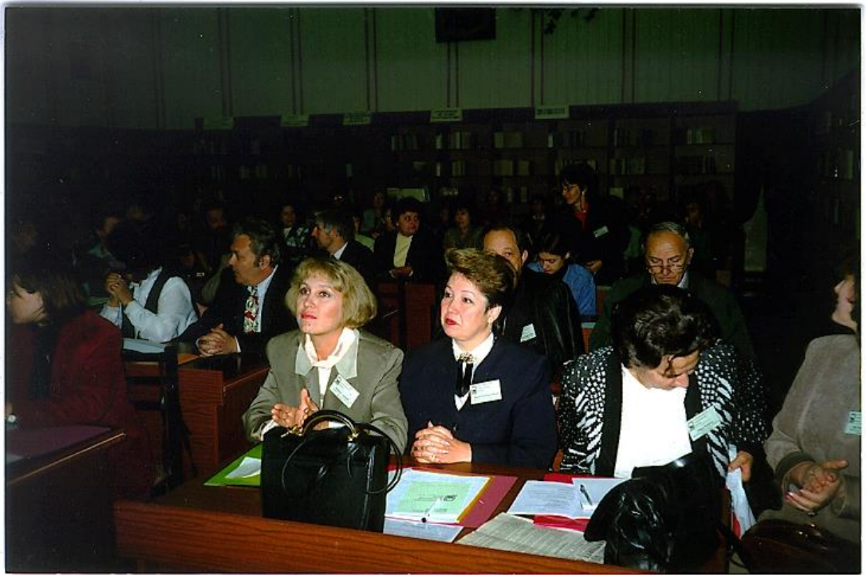
1997 - Conferința Internațională „Modernizarea serviciilor de informare”