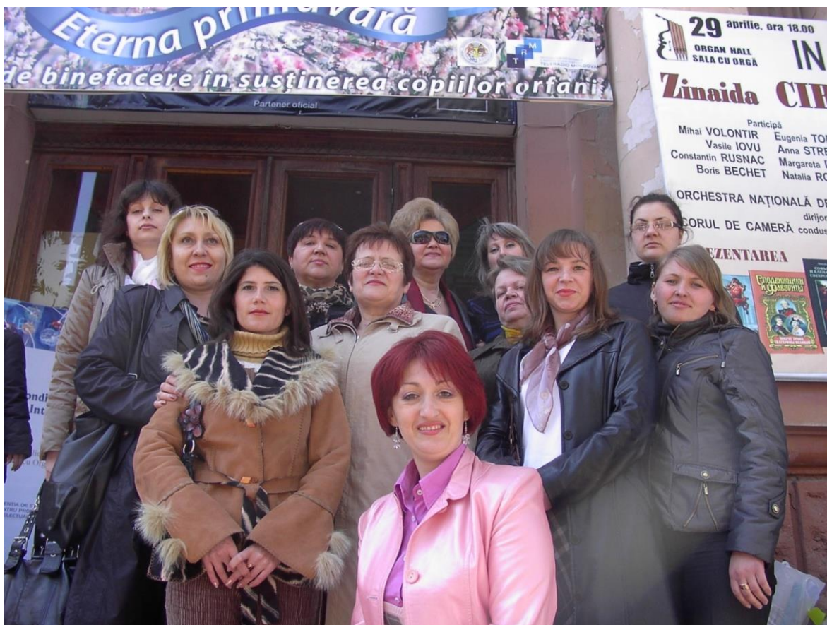
2010 – Bibliotecarii de la ASEM la Ziua Bibliotecarului