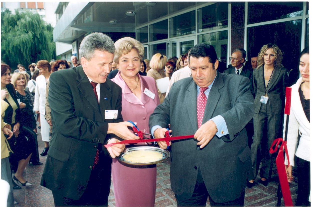
2004 – Inaugurarea Centrului Multimedia