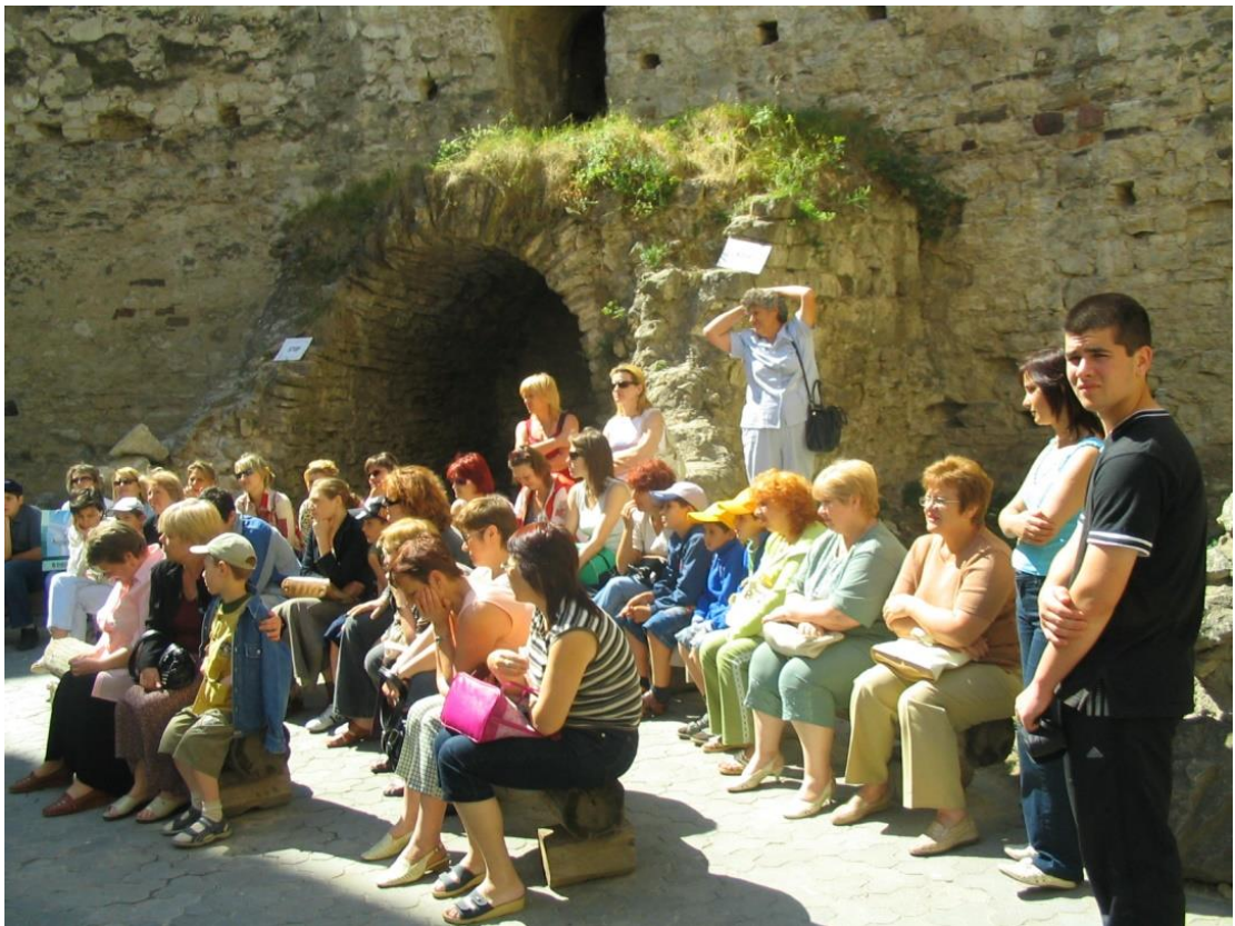
2007 – Colectivul Bibliotecii ASEM în călătorie la Soroca