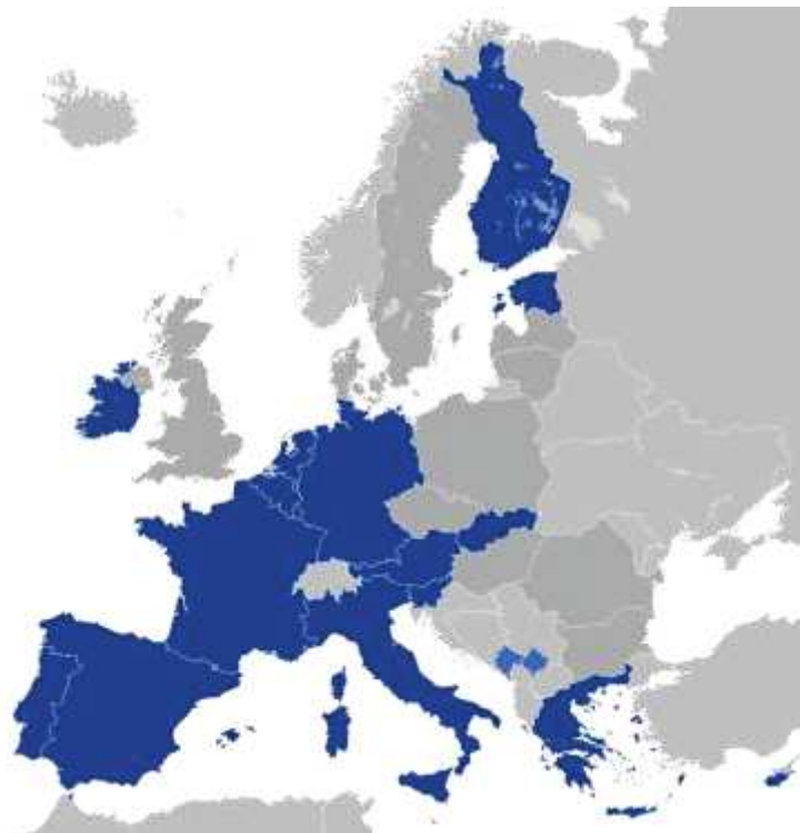
Figura 2. Zona euro

productivității muncii și după adoptarea euro. Scopul e acela de a evita apariția divergenței dintre trendurile productivității muncii în țările nou intrate și trendurile productivității muncii în țările cu productivitate înaltă.” Dar există și cazul Irlandei. Criza din Irlanda nu este surprinzătoare, dat fiind că încă din anii 90, Irlanda nu era bine clasată din punct de vedere economic: „[...] cu excepția Irlandei sau sudului Italiei, în Europa celor nouă, membrii sunt bogați în capital și în forță calificată de muncă.”