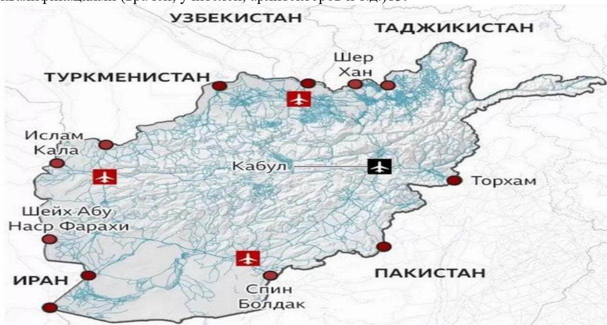
Рисунок 1. Контролируемые талибами пограничные переходы и международные аэропорты в Афганистане.