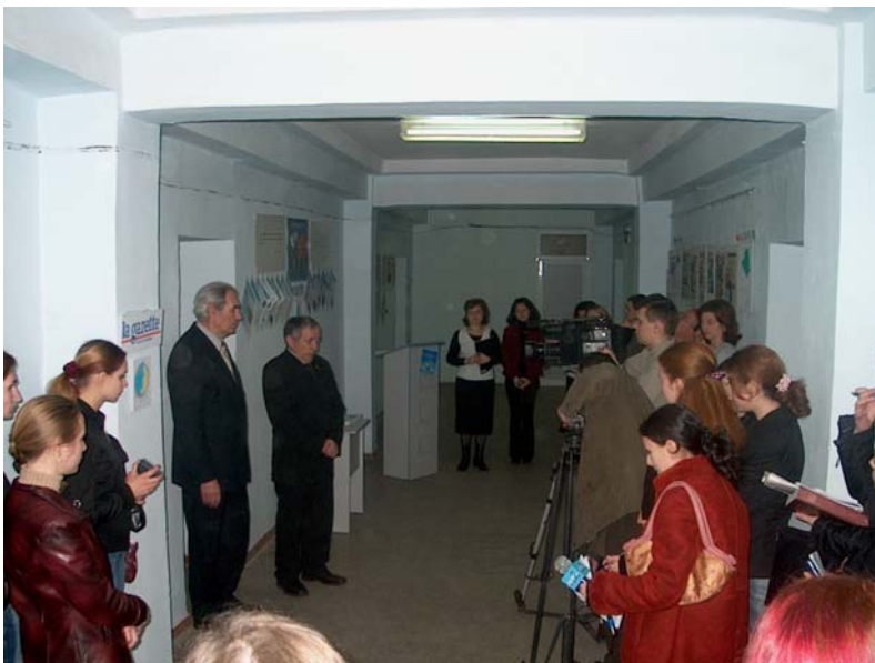
Inaugurarea Expoziției „Presa Africană Francofonă”, USM, 23 martie 2006