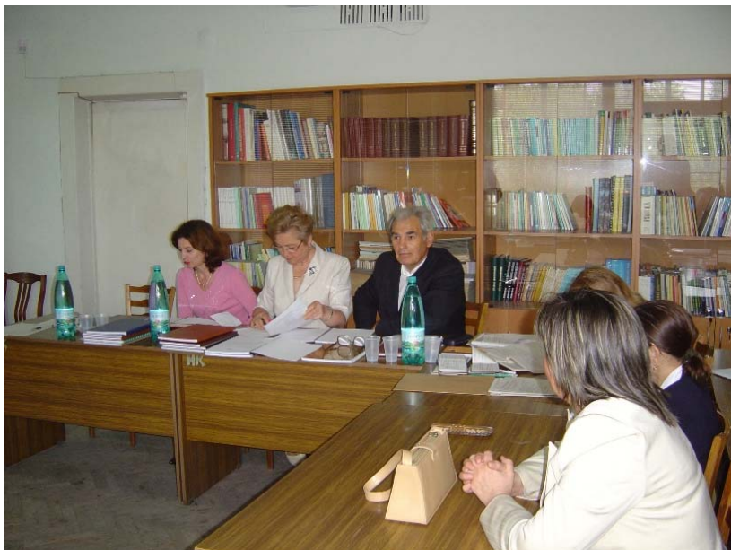
Susținerea tezelor de licență, USM, 2005