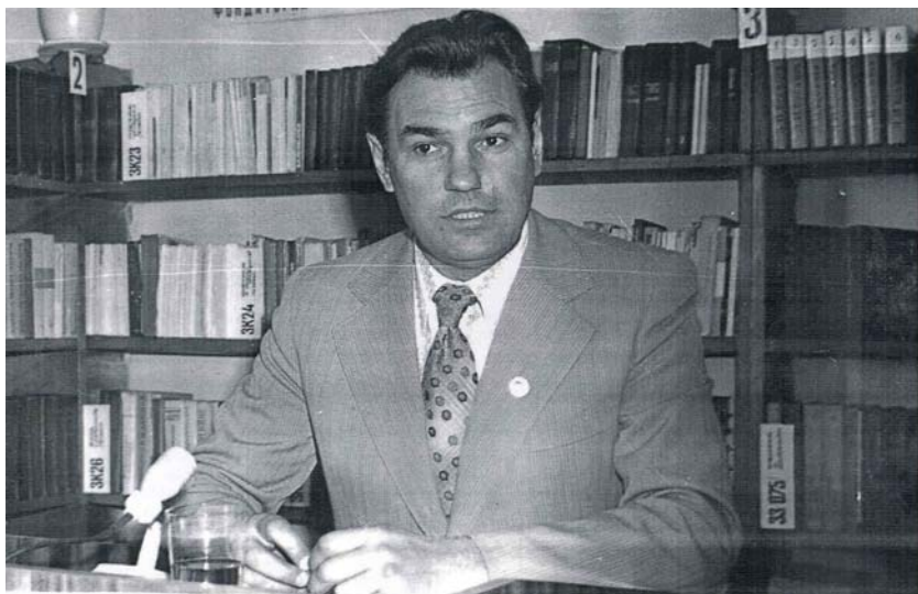
Ion Madan la începutul carierei de pedagog și cercetător, 1973