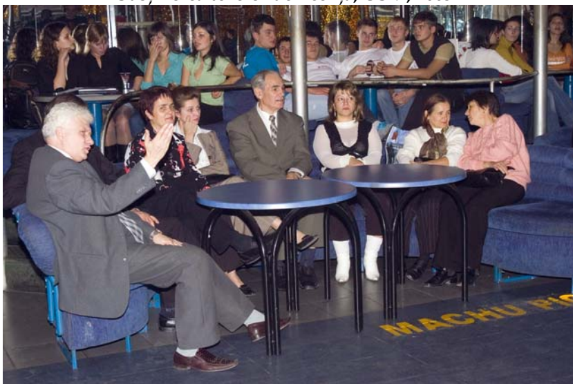
Balul Bobocilor al Facultății „Jurnalism și Științe ale Comunicării”, USM, 2006